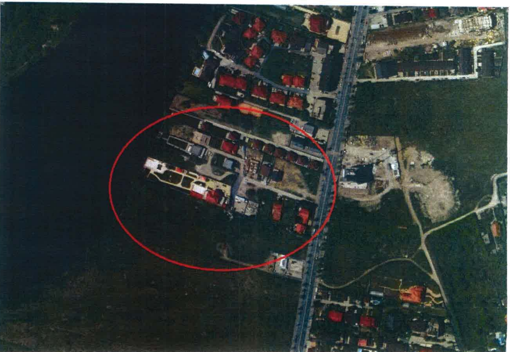
plan satelitar/ortofotoplan cu situatia actuala